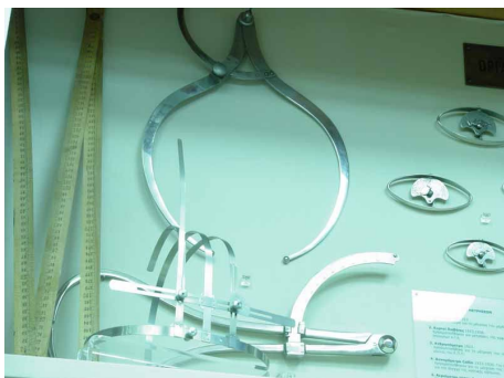
Κυρτοί διαβήτες. Χρησιμοποιήθηκαν για μετρήσεις.

ίδρυση του Μουσείου Ιστορίας της Παιδείας το 1993, τα όργανα αυτά περιήλθαν στην περιουσία του, και ύστερα από κατάλληλη προετοιμασία (συντήρηση, τεκμηρίωση, ταξινόμηση) απετέλεσαν την πρώτη βασική συλλογή του Μουσείου.