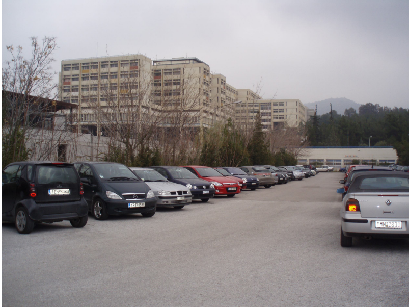
Το κτήριο της Φιλοσοφικής Σχολής