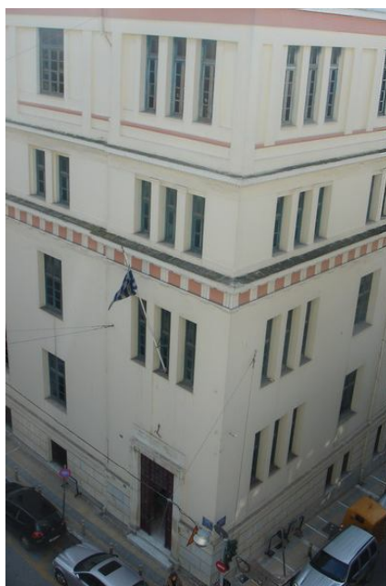
Το Πειραματικό Σχολείο του Πανεπιστημίου Αθηνών

Το Π.Σ.Π.Α. ιδρύθηκε το 1929 με το νόμο 4376 (ΦΕΚ 300/21.8.29) επί Υπουργού Παιδείας Κων. Γόντικα και Πρυτάνεως του Πανεπιστημίου Αθηνών Γ. Ματθαίου. Ο νόμος αυτός τροποποιήθηκε και συμπληρώθηκε το 1930 (Ν.4600). Το Π.Σ.Π.Α. ήταν προσαρτημένο στο Εργαστήριο Πειραματικής Παιδαγωγικής που ανήκε οργανικά στην Τακτική Έδρα της Παιδαγωγικής του Πανεπιστημίου Αθηνών. Η ίδρυσή του αποτέλεσε μια σημαντική πρωτοβουλία σε ευρωπαϊκό επίπεδο.