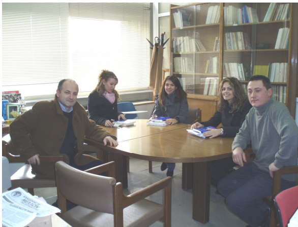
Ομάδα του Κέντρου Περιβαλλοντικής Εκπαίδευσης σε ώρα εργασίας