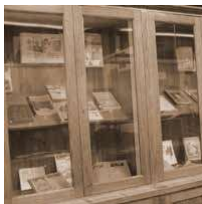
Εικόνες από το Μουσείο Ιστορίας της Παιδείας του Τομέα Παιδαγωγικής