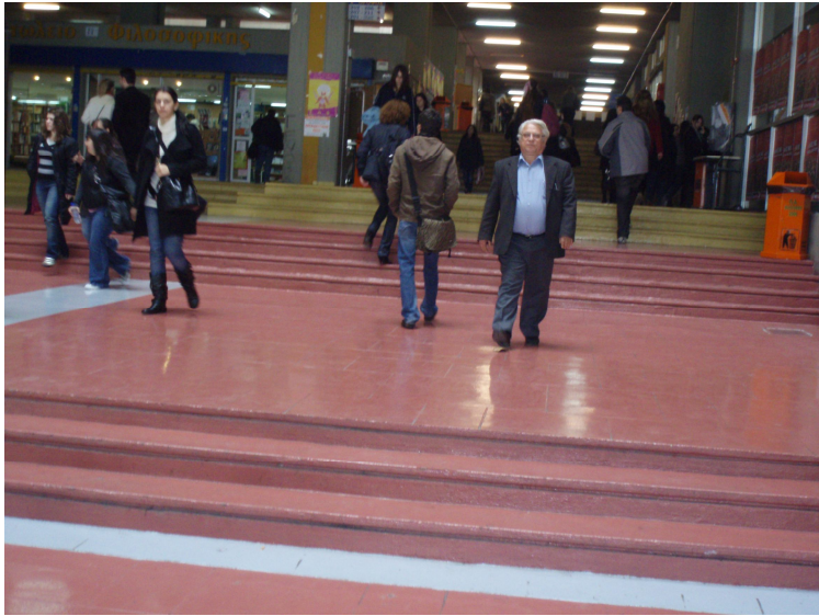
Η είσοδος της Φιλοσοφικής Σχολής