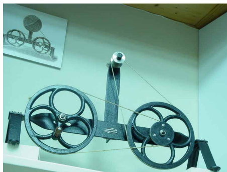
Χειροκίνητος περιστροφέας χρωμάτων. Χρησιμοποιείται για την περιστροφική κίνηση του δίσκου Maxwell, με τον οποίο διαπιστώνεται η ικανότητα αναγνώρισης της πυκνότητας και λαμπρότητας των χρωμάτων. (1925)

Σήμερα, οι κυριότεροι στόχοι του Ε.Π.Π. είναι η προαγωγή της επιστημονικής έρευνας, η παιδαγωγική μόρφωση και άσκηση των φοιτητών, καθώς και η διάδοση των παιδαγωγικών γνώσεων στο ευρύ κοινό, στους εκπαιδευτικούς, στους γονείς και σε άτομα ή θεσμούς που ασχολούνται γενικά με τα θέματα της αγωγής