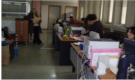
Όψεις της Γραμματείας του Τμήματος Φ.Π.Ψ.

Ο φοιτητής επιλέγει την κατεύθυνση που επιθυμεί στο Γ' Εξάμηνο των σπουδών του.