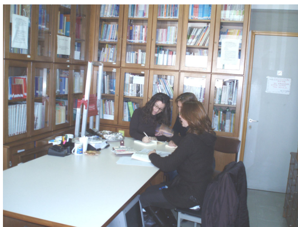
Ομάδα εργασίας του Κέντρου Διαπολιτισμικής Αγωγής