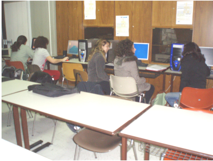
Φοιτητές σε ώρα μαθήματος στο Εργαστήριο Εκπαιδευτικής Τεχνολογίας