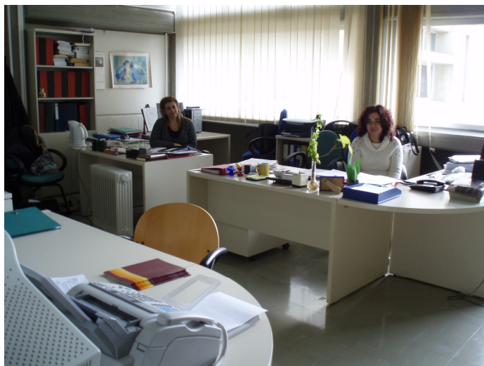
Η Γραμματεία του Τομέα Ψυχολογίας