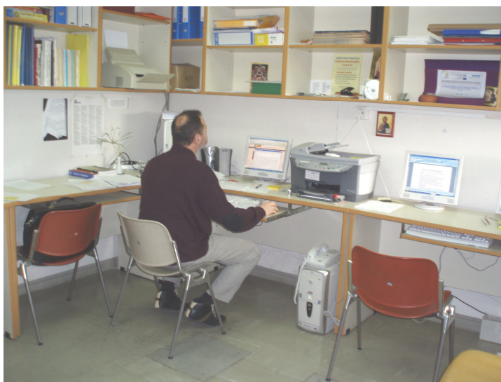
Αίθουσα υπολογιστών του Κέντρου Σ.Ε.Π.

Για την αύξηση των ενημερωτικών, εκπαιδευτικών, ερευνητικών και λοιπών επιστημονικών δραστηριοτήτων του Κέντρου έχει ζητηθεί η μετατροπή του σε Εργαστήριο Εκπαιδευτικού και Επαγγελματικού Προσανατολισμού. Το σχετικό αίτημα έχει εγκριθεί από τη Γενική Συνέλευση του Τμήματος Φιλοσοφίας, Παιδαγωγικής και Ψυχολογίας, καθώς και από τη Σύγκλητο του Πανεπιστημίου Αθηνών και εκκρεμεί η έκδοση σχετικού Προεδρικού Διατάγματος από το ΥΠΕΠΘ.