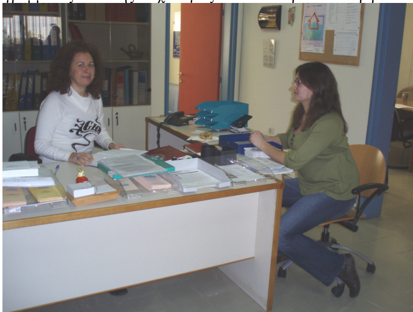
Όψη του Εργαστηρίου Ψυχολογικής Συμβουλευτικής Φοιτητών

Το Εργαστήριο πραγματοποιεί μελέτες σκοπιμότητας και επιδημιολογικές έρευνες, οι οποίες καταδεικνύουν την αναγκαιότητα διαμόρφωσης ανάλογων παρεμβατικών προγραμμάτων. Επίσης, για όλες τις δραστηριότητες διεξάγονται μελέτες αποτελεσματικότητας – αξιολόγησης, στο πλαίσιο πτυχιακών εργασιών του Προγράμματος Ψυχολογίας, διπλωματικών εργασιών του Μεταπτυχιακού Προγράμματος Κλινικής Ψυχολογίας και διδακτορικών διατριβών.