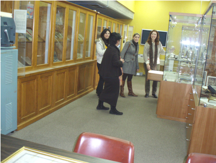
Ενημέρωση για τα εκθέματα του Μουσείου της Παιδείας

'Εικόνες από τη Νεοελληνική Εκπαίδευση και Παιδεία'.