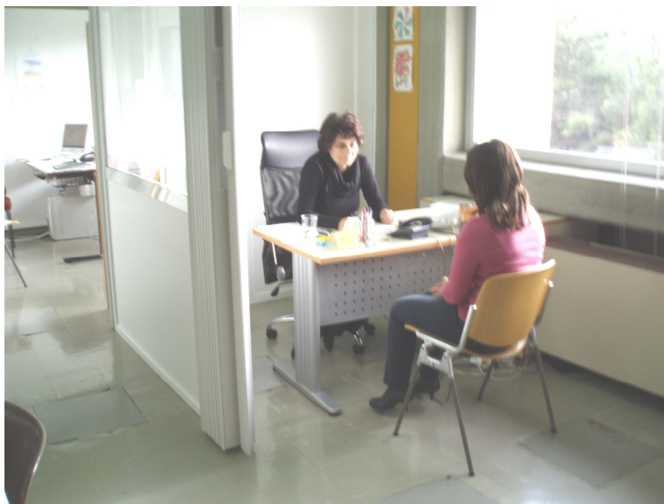
Συμβουλευτική συνέντευξη στο Κέντρο Σ.Ε.Π.

Σκοπός του Κέντρου είναι: α) η παροχή υπηρεσιών Επαγγελματικής Συμβουλευτικής και Προσανατολισμού σε φοιτητές του Πανεπιστημίου Αθηνών, κυρίως, αλλά και σε άλλα πρόσωπα, β) η ανάπτυξη δραστηριοτήτων σχετικών με την επαγγελματική ενημέρωση των φοιτητών και την επιμόρφωση εκπαιδευτικών στο παραπάνω αντικείμενο, γ) η διεξαγωγή σχετικών μελετών και ερευνών, δ) η άσκηση των προπτυχιακών και κυρίως των μεταπτυχιακών φοιτητών στην Επαγγελματική Συμβουλευτική και ε) η υποστήριξη, γενικά του λειτουργούντος στο Τμήμα Φ.Π.Ψ. προγράμματος μεταπτυχιακών σπουδών στη Συμβουλευτική και στον Επαγγελματικό Προσανατολισμό.